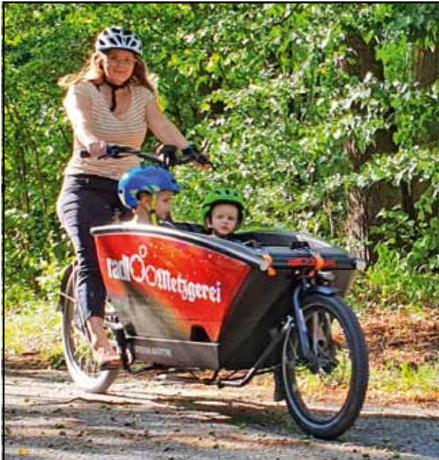
Fahrrad-Demo für die ganze Familie