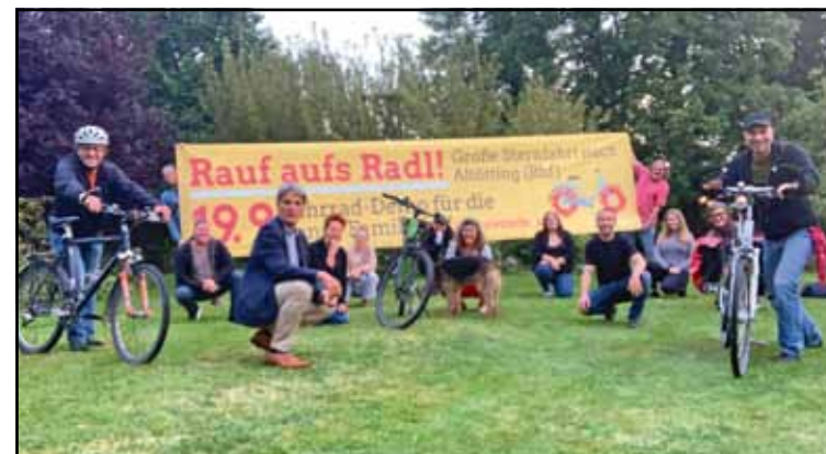
Treffen des Aktionsbündnis Verkehrswende

DB Es gibt natürlich auch die Möglichkeit, mit der Bahn nach Altötting zu reisen. Abfahrt, z.B. in Burghausen 13:45 Uhr und 14:45 Uhr - Dauer 20 min